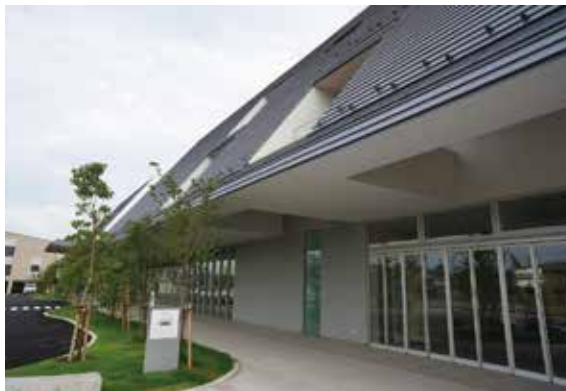
2016年6月17日 第13回建築設備研究 見学会「岐阜県北方町役場 新庁舎」