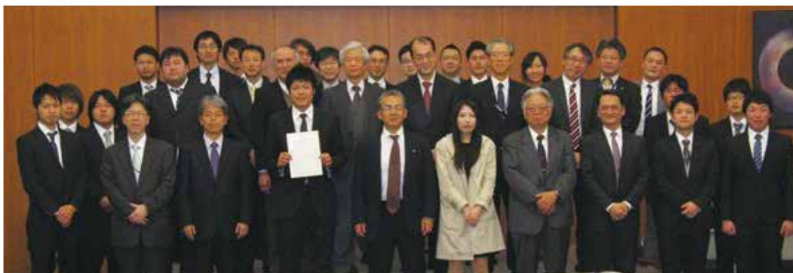
2014年3月17日 支部学術研究発表会交流会