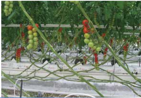
2015年1月21日 うれし野アグリ見学会