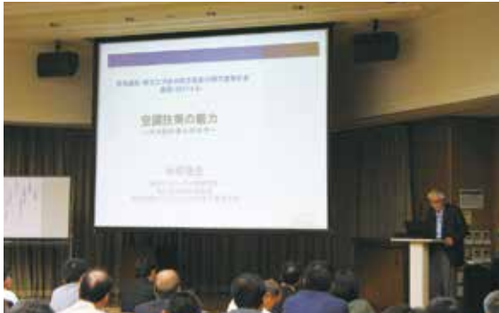
特別講演会の様子