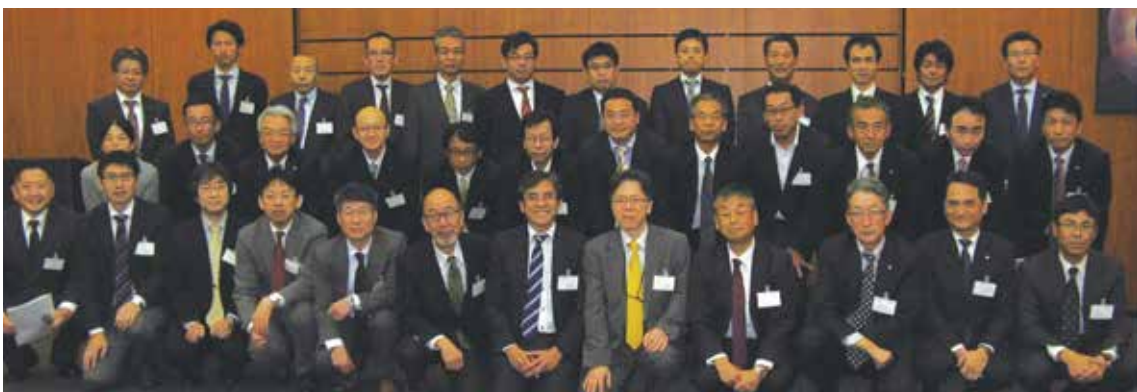
2016年11月24日 支部賛助会員交流会