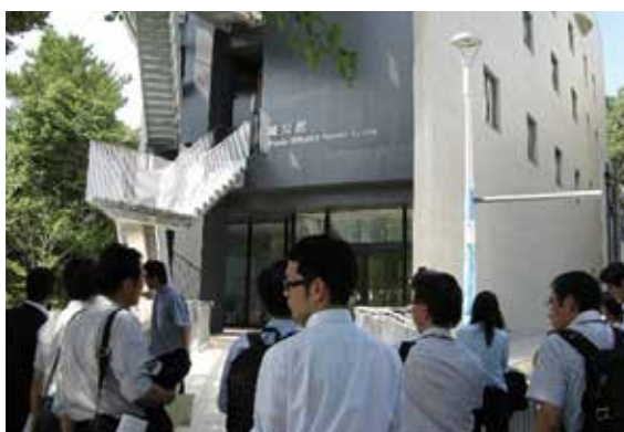
2014年7月25日 名古屋大学減災館見学