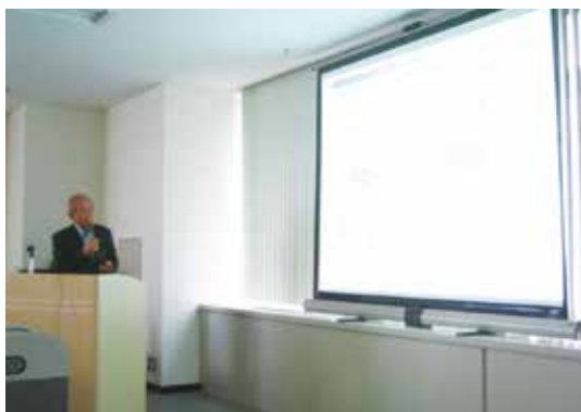
2011年10月21日 第1回建築設備研究会