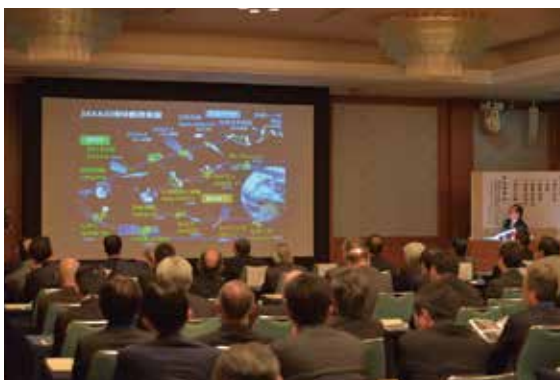
講演: 宇宙航空研究開発機構 (JAXA) 平林毅 様