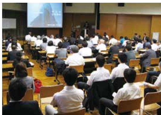
2014年6月9日 支部報告会特別講演「あべのハルカス」