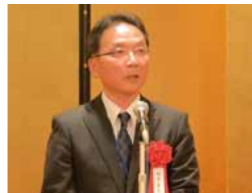
来賓祝辞: 国土交通省中部地方整備局 橋本善弘 様